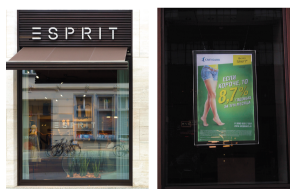
Допустимая конструкция в витрине, не перекрывающая больше половины площади витрины. Такая реклама в витрине допустима. Она перекрывает не более половины площади остекления.