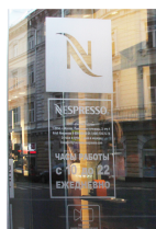
Логотип компании и сведения, требуемые законом «О защите прав потребителей» на остеклении двери.

Информационные таблички — небольшие объекты, располагающиеся на уровне глаз. На них могут быть указаны название организации, время работы, адрес, для ресторанов и кафе – меню. Таблички располагаются на остеклении входных дверей. Допустимо размещение сведений в соответствии с законом РФ «О защите прав потребителей» (статья 9 пункт 1: наименование организации, ее адрес и режим работы). На табличке может быть размещена только следующая информация: название организации, логотип, род деятельности, время работы, адрес. Максимальный размер табличек – 0,3м по ширине и 0,4м по высоте. Табличка на остеклении входа всегда должна быть однотонной и выполнена трафаретной печатью без фона. Нижний край таблички не должен быть установлен выше уровня 1,5м.